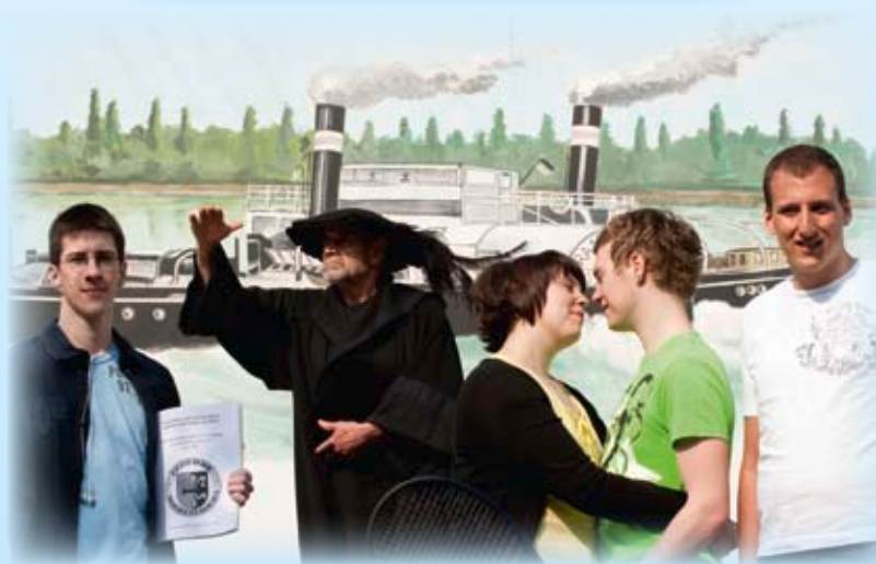
Der Flößer und die Prologsprecher

Samstag, 27. Juni 2009, 20:00 Uhr Sonntag, 28. Juni 2009, 20:00 Uhr